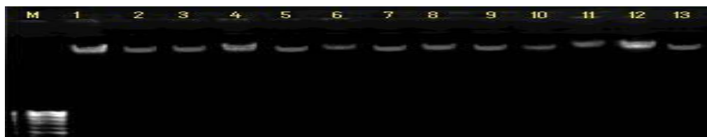
شکل ۱- DNA ژنومی استخراج شده تعدادی از ژنوتیپ‌های گندم Figure 1. Extracted genomic DNA from some wheat genotypes

بررسی کیفیت نمونه‌های DNA استخراج شده با استفاده از ژل آگارز (شکل ۱) و دستگاه پیکودراپ نشان داد که DNAها از کیفیت مطلوبی برخوردارند. آغازگرهای مورد استفاده در مجموع ۶۹ آلل را در تمام ژنوتیپ‌ها، برای هر مکان شناسایی و تکثیر کردند، تعداد آلل تکثیر شده توسط آغازگرها از ۲ آلل (آغازگرهای Xcfd40 و Xgwm369) تا ۵ آلل (آغازگر Xbarc54) متغیر بود. میانگین تعداد آلل ۳/۴۵ آلل در هر مکان ژنی بود و واکنش‌های PCR با استفاده از آغازگرهای SSR قطعاتی را تکثیر کرد که طول آنها بین ۵۰ تا ۳۵۰ جفت باز متغیر بود. آغازگرهای Xcfa2164 و Xbarc54 موجود بر روی کروموزوم 3A و Xbarc148 بر روی کروموزوم 1A در تمام ژنوتیپ‌ها